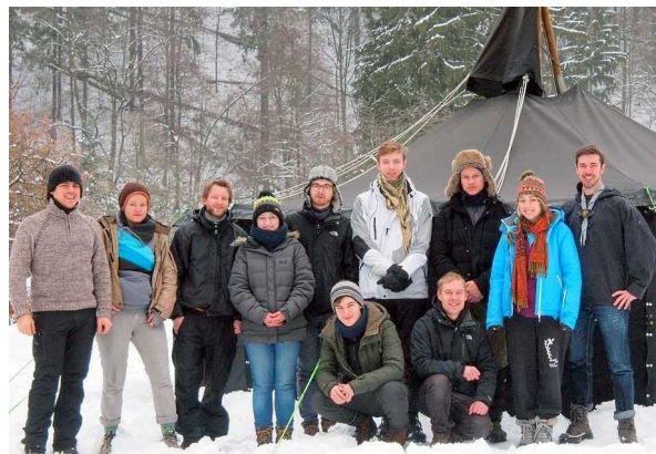
Winterlager mit der Leiterrunde im Elbsandsteingebirge. Das nächste Winterlager, auch offen für potentielle neue Leiter, findet vom 16. bis 18. Februar 2018 statt.