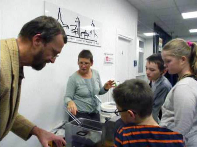
Basar in St. Alfons