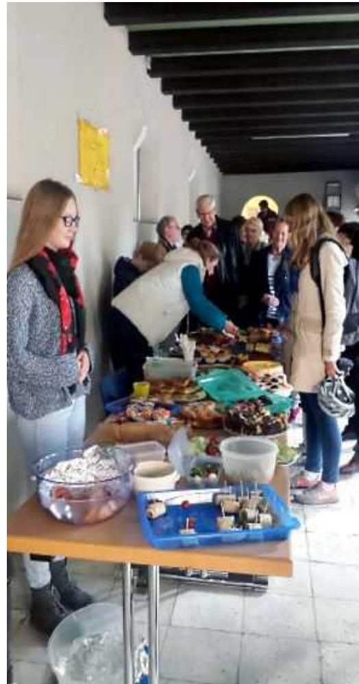
Jugendliche bei der Missio-Aktion