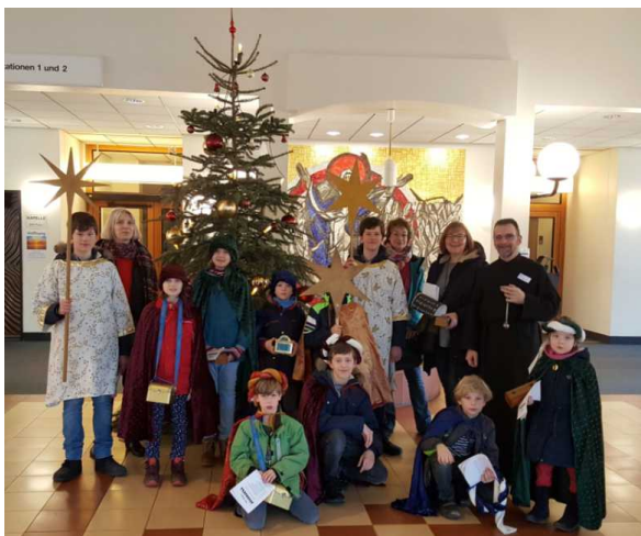
Sternsinger im St. Marien-Krankenhaus