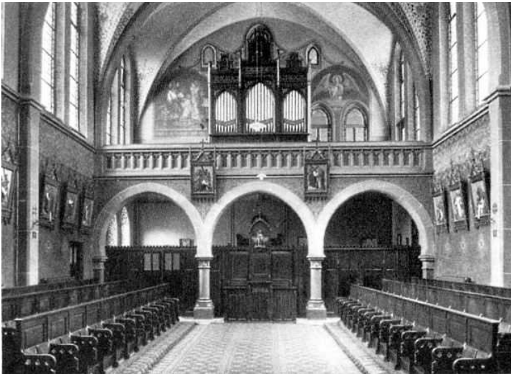
Alter Standort der Orgel im Schwesternschiff

Sie kann in doppelter Hinsicht und im besten Sinne als ein historisches Instrument eingestuft werden. Den Ausschlag gibt zum einen ihr Alter, da das Instrument bereits 1888 von der Firma Fleiter gebaut wurde. Das allein wäre noch nicht so ungewöhnlich, es kommt aber hinzu, dass es sich bei unserem