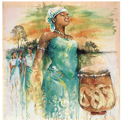
Plakat zum Weltgebetstag 2018

Surinam ist das kleinste Land Südamerikas und liegt im Nordosten zwischen Guyana, Brasilien und Französisch-Guyana. Auf einer Fläche, die weniger als halb so groß wie die Bundesrepublik Deutschland ist, leben rund 540.000 Menschen, die unter anderem indigene, afrikanische, europäische, indische, javanische und chinesische Wurzeln haben. Seit dem 17. Jahrhundert war Surinam bis 1975 niederländische Kolonie, in der neben den fünf indigenen Stämmen aus Afrika verschleppte Sklaven schufteten und nach Abschaffung der Sklaverei 1863 zunehmend Menschen aus Asiatischen Ländern zur Arbeit angeworben wurden.