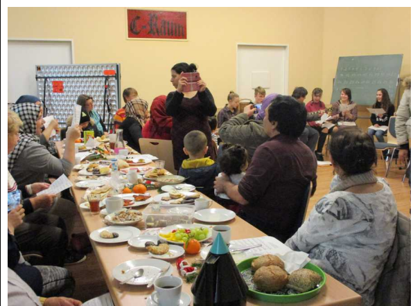
Adventsfrühstück, Hildegard-Schule hilft