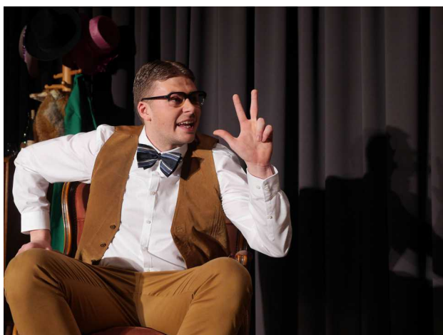
Theateraufführung „Die Spanische Fliege“, Georg Faerber