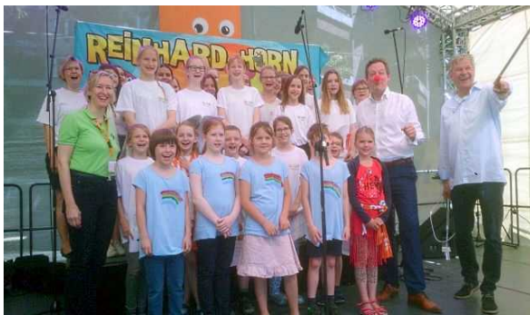
Kinder- und Jugendchor St. Alfons beim Kirchentag in Berlin