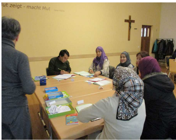
Deutschkurs unter dem Kreuz