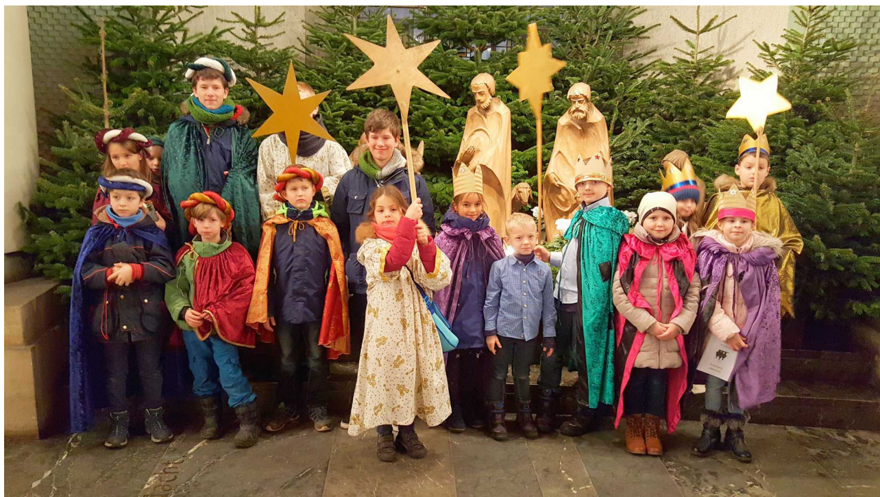
Sternsinger aus dem Pastoralen Raum beim Aussendungsgottesdienst