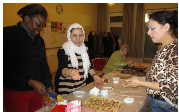
Wel(I)come beim Keksebacken