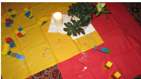
Taizé-Andacht in Mater Dolorosa