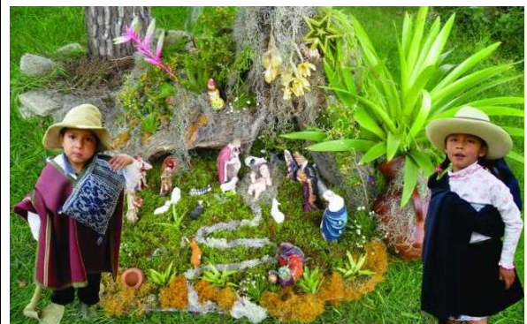
Weihnachtsgruß aus Chachapoyas